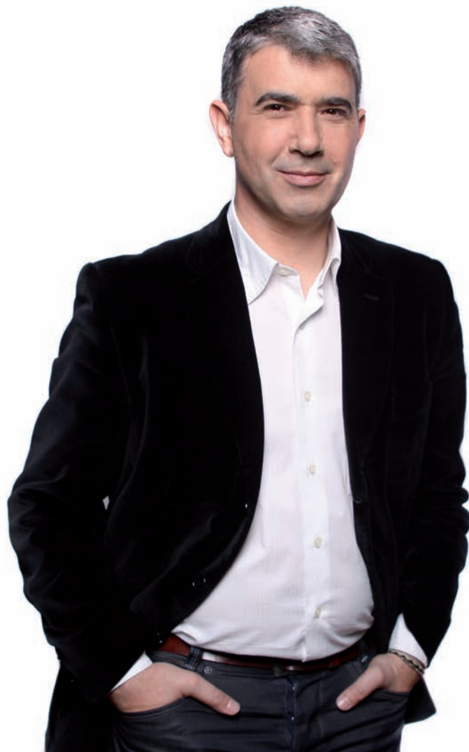
Juan Martín, Portavoz de CHA en el Ayuntamiento de Zaragoza. Candidato a la alcaldía.