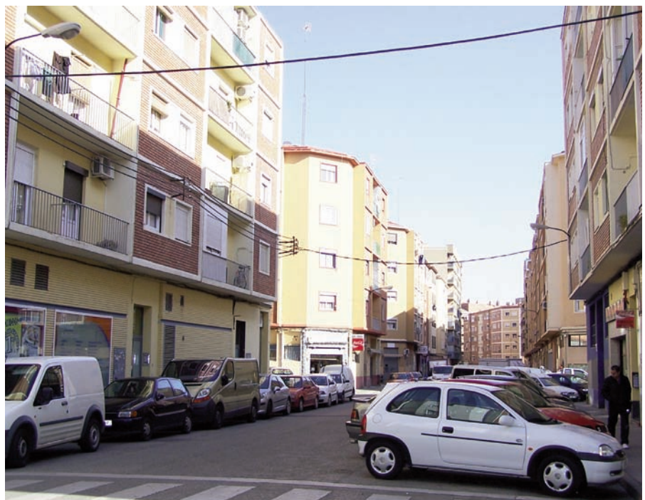
San José necesita proyectos reales de rehabilitación para muchas de sus viviendas y calles.

programar las mejoras urbanísticas sobre espacios públicos, así como las actuaciones de rehabilitación necesarias, junto con el aumento de los programas sociales. Frente a esta manera de trabajar y de proponer las cosas, frente a este consenso , el PSOE y el PAR apuestan por la recalificación de suelo para construir más de 4.000 viviendas entre las vías del tren y el tercer cinturón, a su paso por las Fuentes. Su proyecto no es una operación de “Rehabilitación de los barrios del este de la ciudad”, es una OPERACIÓN de RECALIFICACIÓN de suelo no urbanizable.