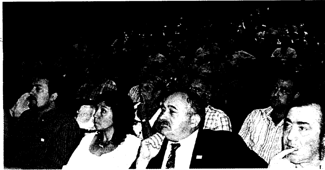
El Palacio de Congresos de Jaca vivió momentos tristes en la jornada de ayer, en la que acudieron u