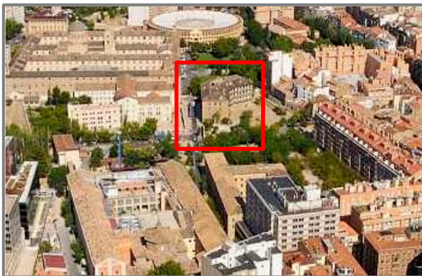
Vista aérea del edificio catalogado de Calle Madre Rafols 8-10-12

Además el PICH también pone de manifiesto la carencia de residencias para jóvenes y, en este sentido, plantea en el programa 2.1.2.9 la edificación de viviendas o residencias para jóvenes en edificio catalogado de Madre Rafols