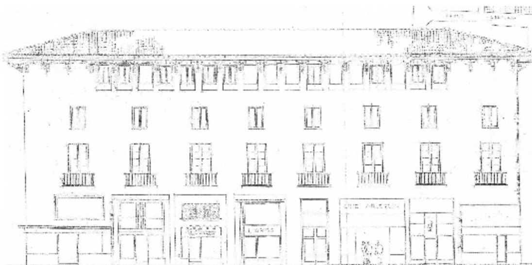
Palacio de Fuenclara

Instalar este centro de interpretación en una antigua imprenta, en el Casco Histórico, en un edificio firmado por un arquitecto de gran prestigio - Teodoro Ríos Balaguer autor, entre otros edificios, del Palacio Provincial de Zaragoza- tiene todos los ingredientes para llevar a cabo una infraestructura de Ciudad, que revitalice ese área del Casco Histórico, dándole vida y uso más allá del horario de oficinas y rememorando la historia de la imprenta en Zaragoza que tiene el honor de ser una de las primeras de Europa que utilizó el ingenio de Güttemberg. En 1475, apareció en la Ciudad el “Manipulus curatorum” de Guido de Monte Rotheri, impreso por Mateo Flandro, de origen alemán, iniciando una tradición en el arte impresorio cesaraugustano que siguieron los hermanos Juan y Pablo Hurus, Enrique Botel, Leonardo Hutz, Juan Planck, Lupo Appentegger o Jorge Cocci.