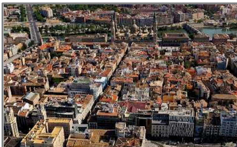
Vista aérea de parte del Casco Histórico

Por lo tanto, ésta debe ser la base sobre la que plantear propuestas para el Casco Histórico con una visión estratégica más allá de situaciones coyunturales o cortoplacistas.