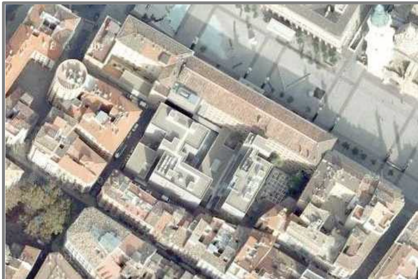
Vista aérea del edificio de los Juzgados de Plaza del Pilar